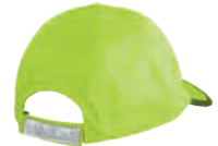
EASY TEAR RELEASE REFLECTIVE SIZE ADJUSTER